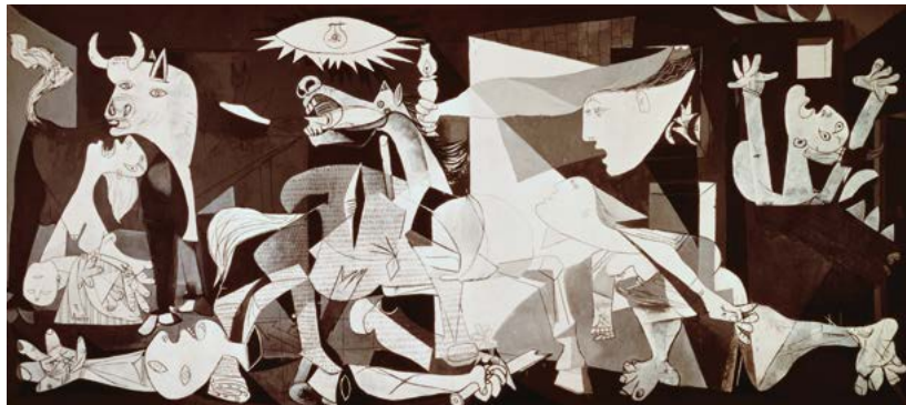
Pablo Picasso, Guernica , 1937 r.