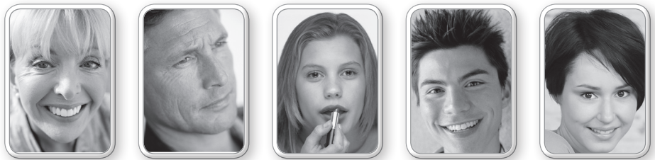
a _____ b _____ c _____ d _____ e _____